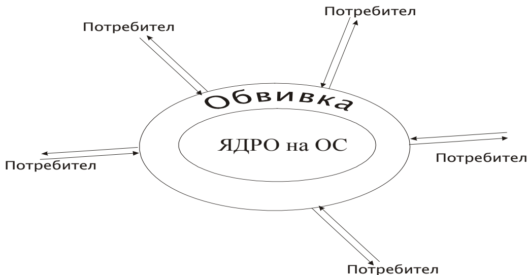
Фиг 3.2 Компоненти на операционната система

информация на външни устройства; организира разпределението на пространството върху носителите на външните устройства. За да се осигури надеждно опериране с данните и програмите се въвежда понятието файл . Файлът е савкупност от данни, разпределени в отделни групи, наречени записи. Цялата информация, което се съхранява на външни носители се оформя като файлове. Файлове са текстовете на програмите, документите, които се редактират с текстови редактори, графичните изображения и др.